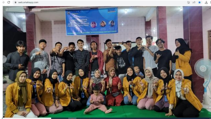
Gambar 4. Dokumentasi Kegiatan

meningkatkan kesadaran dan sikap remaja terhadap pencegahan bullying. Selain peningkatan pengetahuan, kegiatan ini juga berdampak positif terhadap sikap peserta. Diskusi kelompok mendorong terbangunnya rasa saling menghargai dan kesadaran untuk tidak menjadi pelaku maupun membiarkan perundungan terjadi di sekitar mereka. Dengan demikian, intervensi ini bukan hanya memberikan pemahaman teoritis, tetapi juga memotivasi remaja untuk menerapkan perilaku positif dalam kehidupan sehari-hari (Rahayu & Permana, 2019). Berikut dokumentasi tim pelaksana kegiatan :