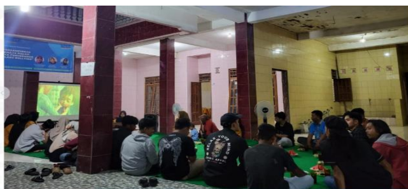
Gambar 3. Pemberian Edukasi kepada Remaja

Gambar 2 di atas, menunjukkan sebagian besar Remaja Dukuh Kupang Karangdowo memiliki pengetahuan perundungan kategori baik sebanyak 18 orang (72%) dan Pengetahuan perundungan Cukup 7 orang (28 %).