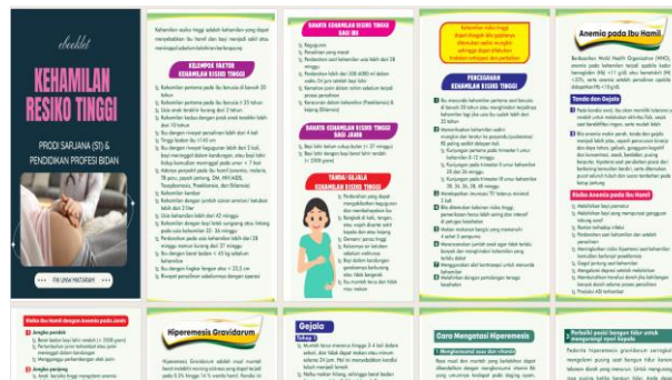
Gambar 2. Media ebooklet yang Digunakan dalam Penyuluhan

Penggunaan media digital ini dirancang dengan bahasa sederhana, ilustrasi gambar dan bahasa yang mudah dipahami diharapkan bisa membuat peserta mudah memahami informasi yang disampaikan serta bisa dibuka kapan saja setelah kegiatan kelas hamil dilaksanakan (Mardiah et al., 2024).