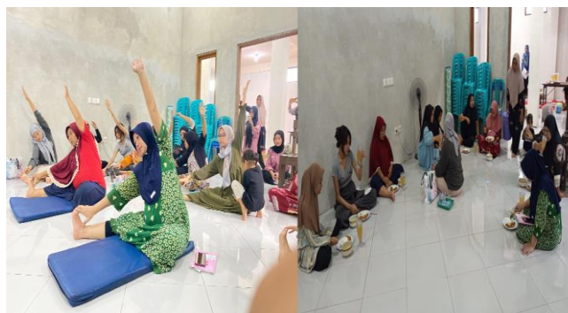
Gambar 2. Senam hamil dan makan bergizi “Begibung”

Setelah penyuluhan dilakukan, dilanjutkan kegiatan senam ibu hamil serta makan bergizi secara bersama-sama setelah kegiatan kelas selesai yang disebut “Program Begibung” yang merupakan program dari Desa.