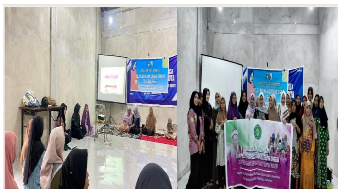
Gambar 1. Penyuluhan Ibu Hamil Risiko Tinggi pada Kelas Ibu Hamil

Kategori kehamilan risiko tinggi jika dibandingkan dengan kategori lainnya mempunyai risiko yang lebih besar untuk terjadinya komplikasi. Risiko 4T yang ditemukan dalam kehamilan dapat menimbulkan perdarahan, keguguran, persalinan lama, dan anemia. Penting dilakukan penyuluhan pada ibu hamil dengan kehamilan risiko tinggi sebagai upaya strategi promotif dan preventif yang efektif dalam meningkatkan pengetahuan dan kesadaran ibu hamil terhadap kondisi kehamilannya. Pentingnya peningkatan pengetahuan ini agar ibu hamil bisa melakukan deteksi dini, karena kehamilan risiko tinggi memiliki potensi besar menimbulkan komplikasi yang dapat membahayakan ibu dan janin bila tidak ditangani segera (Dewi et al., 2019). Ibu hamil perlu berperan aktif dalam mencari dan menerima informasi kesehatan terkait kehamilan dan memeriksakan antenatal secara rutin untuk mendeteksi dini risiko kehamilan (Arsenault et al., 2024). Lebih lanjut, pentingnya pemeriksaan antenatal ini akan memiliki dampak besar bagi penurunan kematian neonatal. Sebagaimana hasil penelitian menunjukkan bahwa kematian neonatal pada bayi baru lahir dari ibu yang memperoleh perawatan antenatal 65% lebih rendah dibandingkan dengan bayi baru lahir dari ibu yang tidak memiliki tindak lanjut perawatan antenatal (OR: 0,35, 95% CI: 0,24, 0,51) (Tolossa et al., 2020).