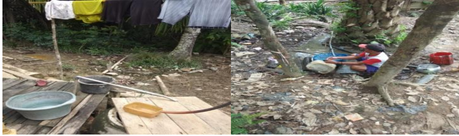
Gambar 1 Kondisi masyarakat dengan perilaku hidup bersih

Pada Gambar 1 merupakan Kondisi masyarakat dengan perilaku hidup bersih masih kurang di Kampung Bukit Blok C & D, RT/RW 04/03 Dusun Pasrah, Desa Tumiang.