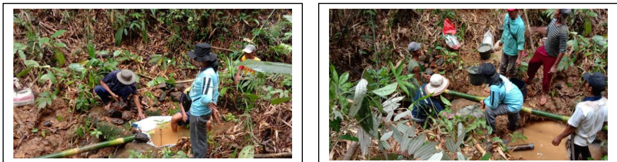
Gambar 3 Kegiatan sosial berkoordinasi dalam pelaksanaan pembuatan fasilitas air bersih