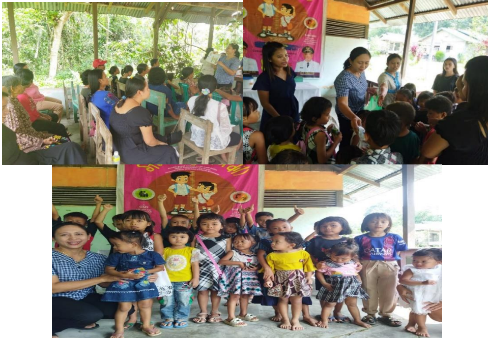
Gambar 2 Kegiatan Pengajaran dan Pelatihan Perilaku Hidup Bersih dan Sehat

Pada Gambar 1 merupakan Kondisi masyarakat dengan perilaku hidup bersih masih kurang di Kampung Bukit Blok C & D, RT/RW 04/03 Dusun Pasrah, Desa Tumiang.